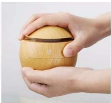
Odstraňte kryt přístroje.