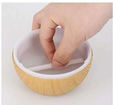
Ponořte filtr na minutu pod vodu. Přístroj složte.