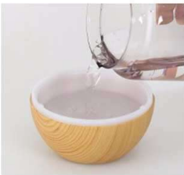
Naplňte nádobu vodou.