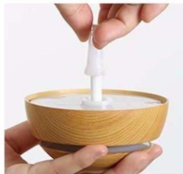
Odstraňte kryt bavlněného filtru.